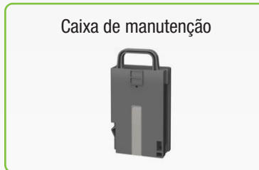
Caixa de manutenção