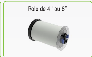
Rolo de 4" ou 8"

1. Velocidade baseada no modo de velocidade máxima de 300 dpi x 600 dpi (largura de 89 mm).