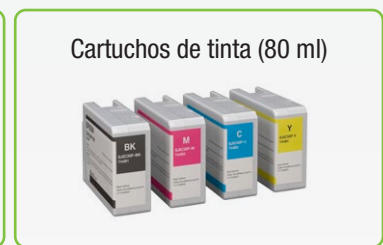
Cartuchos de tinta (80 ml)