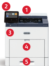
Impressora Xerox® VersaLink B600 Impressão.