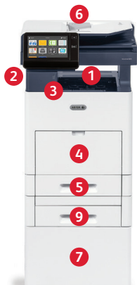
Multifuncional Xerox® VersaLink B605 Impressão. Cópia. Digitalização. Fax. E-mail.